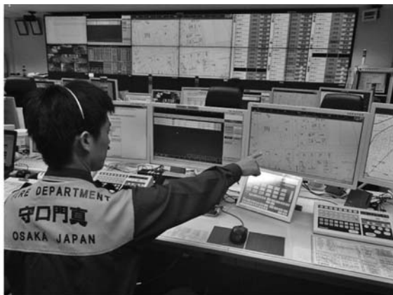
統合型位置情報通知システム