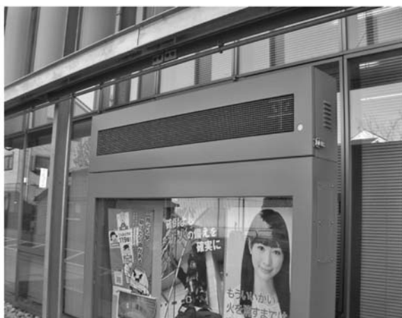
メッセージボード