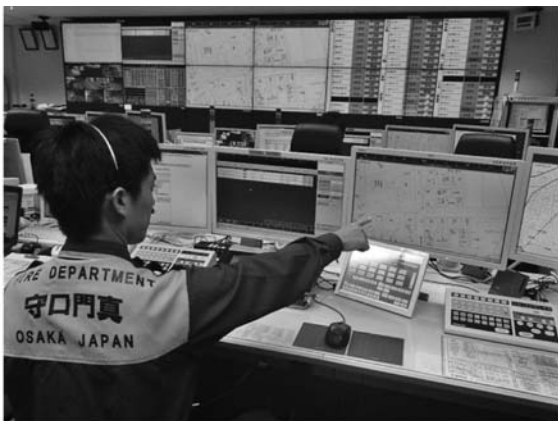
統合型位置情報通知システム