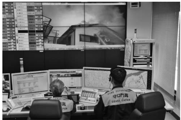
現場指揮端末からの映像